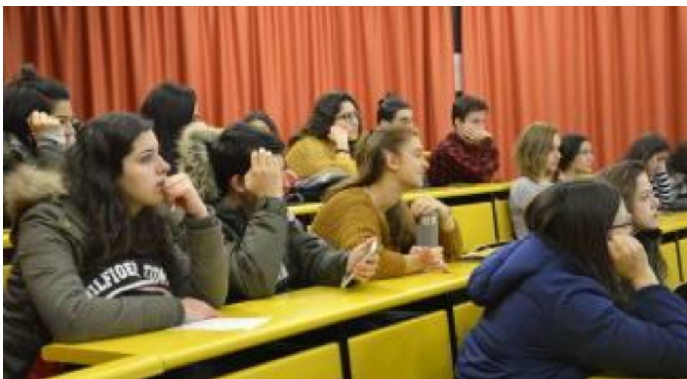
Figura 1. Aula tipo da Facultade de CC. da Educación