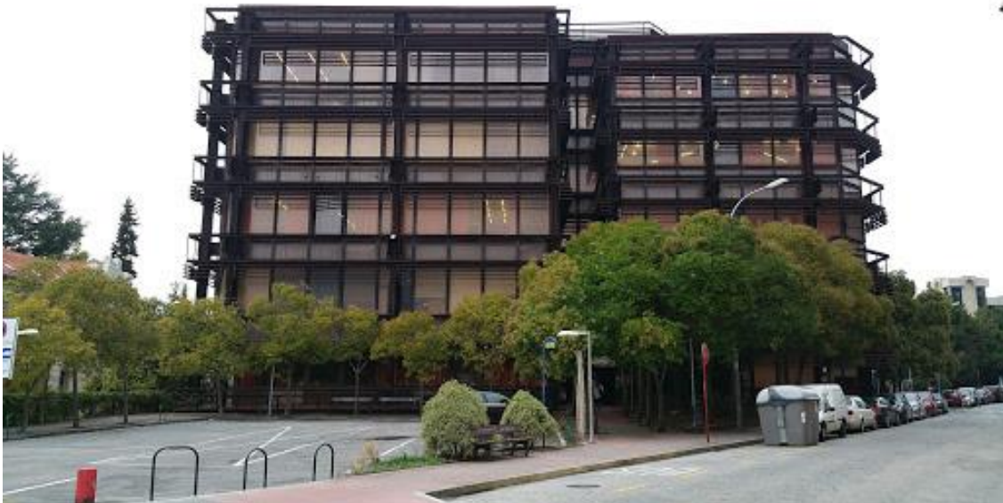
Figura 1. O Edificio de Ferro alberga as aulas onde se imparten os títulos do Centro

Atendendo aos diversos Graos (Educación Infantil, Educación Primaria, Educación Social, Traballo Social), que oferta a Facultade de CC. da Educación de Ourense (Figura 1 e 2), preséntase neste subepígrafe unha síntese das accións de coordinación docente desenvoltas (Táboa 3).